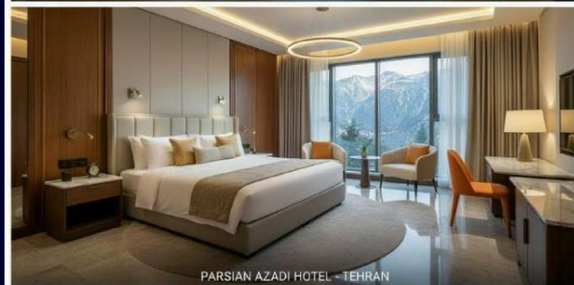
PARSIAN AZADI HOTEL - TEHRAN

Расположенные поблизости достопримечательности, такие как Darakeh (2,9 км) и Tehran International Exhibition (4,5 км), превращают отель Espinas Palace Hotel в отличное место пребывания для гостей Тегерана.