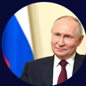
Президент Российской Федерации Владимир Владимирович Путин

Проведение совместной выставки (Выставка Евразия с 4 по 7 декабря 2023 года) в Тегеране, свидетельствует о сильном интересе российских компаний к установлению более плодотворных экономических и торговых отношений между двумя странами