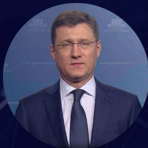
Заместитель Председателя Правительства Российской Федерации Александр Валентинович Новак

Иран может стать эффективной платформой для раскрытия потенциала стран Евразии в области торгового обмена и экономического развития. Посредством совместных инвестиций в различные экономические сферы мы можем не только способствовать росту экономического благосостояния, но и вносить вклад в Укрепление двусторонних отношений.