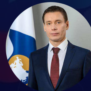
Член Коллегии (Министр) по торговле, Евразийская экономическая комиссия Слепнев Андрей Александрович

Отношения России и Ирана активно развиваются по широкому спектру направлений: в экономике, здравоохранении, науке, машиностроении, технологиях будущего, космической сфере, расширяются гуманитарные связи. Особо отмечается рост взаимного туристического интереса между гражданами России и Ирана. 2. Убедительная выставка EURASIA Expo в Тегеране станет центром притяжения гостей и участников, а многоформатное сотрудничество двух стран станет темой для продуктивного диалога на площадках деловых мероприятий при участии Фонда Росконгресс, которые состоятся в России и в Иране в 2025 году.