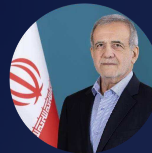
Президент Исламской Республики Иран Масуд Пезешкиан

Проведение совместной выставки (Выставка Евразия с 4 по 7 декабря 2023 года) в Тегеране, свидетельствует о сильном интересе российских компаний к установлению более плодотворных экономических и торговых отношений между двумя странами