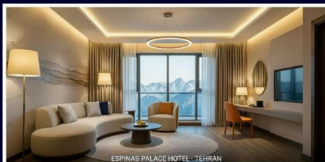
ESPINAS PALACE HOTEL - TEHRAN

Элитный отель, оборудованный по последнему слову техники, пребывание в котором позволит превратить в отдых даже рабочий