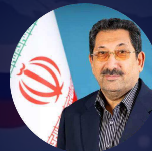
Министр промышленности, торговли и горной промышленности Исламской Республики Иран Сайед Мохаммад Аттабак

Важным направлением взаимодействия с Ираном является развитие торговых связей на евразийском пространстве, и выставка является отличным инструментом для достижения этой цели.